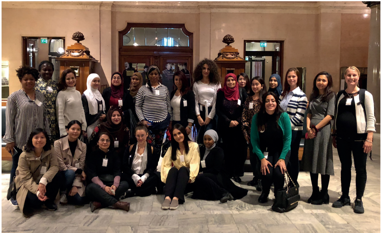
Demokratiambassadörer på studiebesök i riksdagen, september 2018