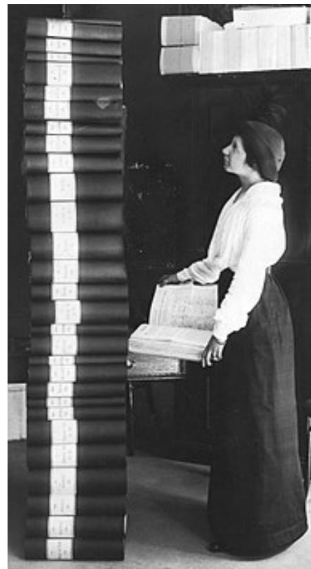
Rösträttsaktivisten Elin Wägner framför de 350 000 underskrifter som samlades in för kvinnors rösträtt 1913 -1914.

Efter avslagen har arbetet med att förbereda ett alternativt, mindre kostnadskrävande firande av rösträtten fortsatt. Information om när och hur detta ska ske kommer att ges i början av året.